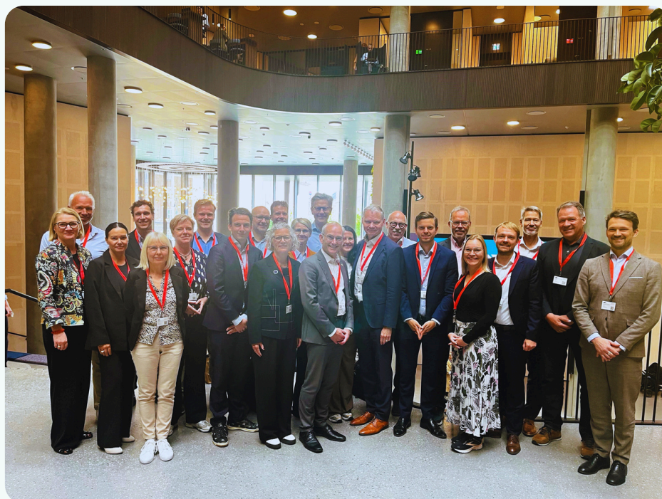
26 organisationer gået sammen om at etablere Forebyggelsesalliancen for fremtidens sundhed. Dansk Psykoterapeutforening blev medlem i 2025.

I samarbejdet med Sammen om Mental Sundhed har foreningen bidraget til alliancens arbejde med afstigmatisering af psykisk sygdom på arbejdspladser. Foreningen har også haft en dialog med Center for Ludomani om et samarbejde, hvor privatpraktiserende psykoterapeuter kan bistå ved spidsbelastninger.